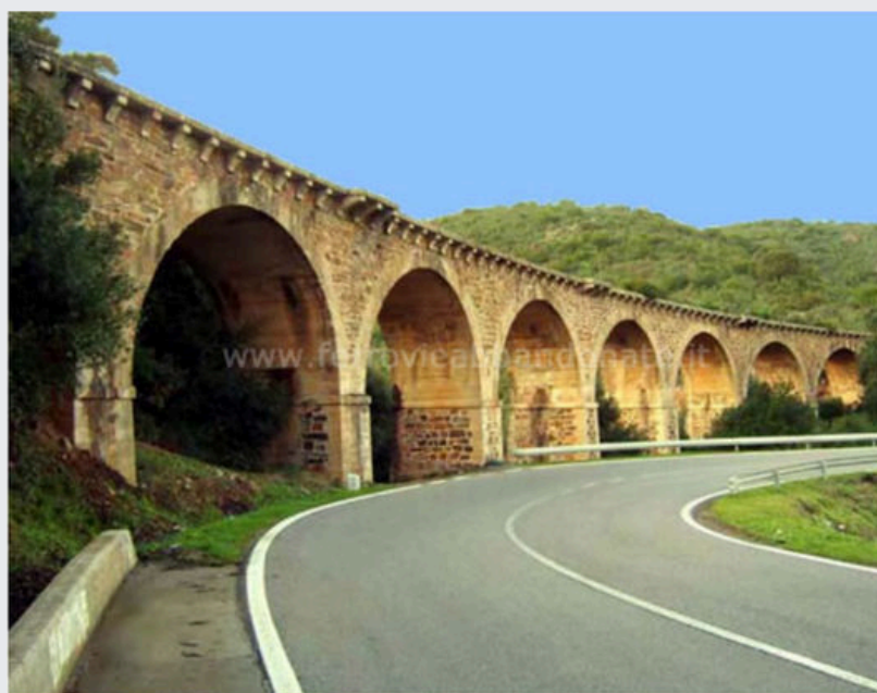
Viadotto sul rio Bacu de Moi, in buone condizioni di conservazione (G. Pintore)