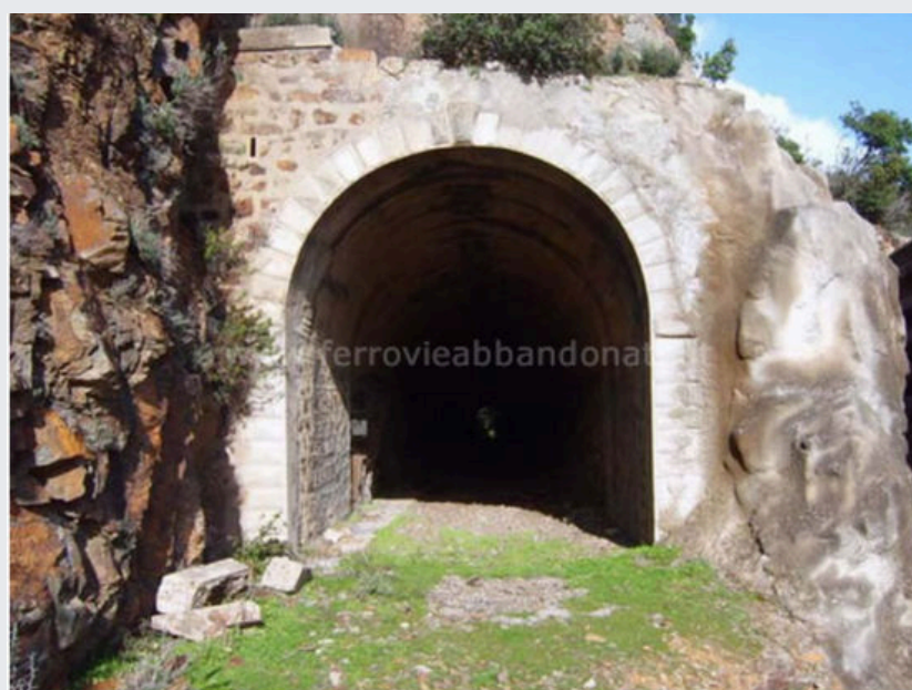
Galleria Gutturu Ruinas (G. Pintore)