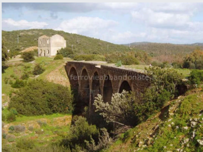
Viadotto sul rio Gutturu Ruinas, tra Siliqua e Campanasissa. Sullo sfondo una ex-stazione, parzialmente crollata

Su 1 de cabudanni de su 1974 cun sa lei 309 iant decìdiu de serrai po sempri is àteras lìnias po favoressi su treru a is màchinas. Oi abarrant pontis e viadotus, gallerias e statzionis e contoneris.