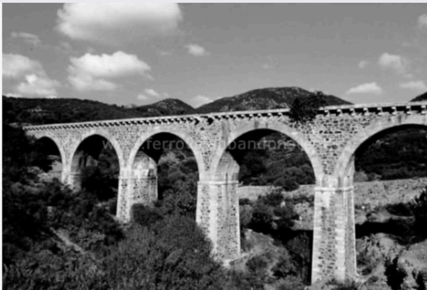
Immagine storica del viadotto sul rio Gutturu Ruinas, tra Siliqua e Campanasissa.

Difatis in is primus dexi annus de su Noixentus giai si fut cumentzau a pentzai a una l`inia ferroviària chi poniat in collegamentu su Sulcis cun Casteddu e iant aprovau de fabricai sa l`inea Silicua - Caleseda chi passàt po Santadi. In su mesi de idas de su 1914 in Roma iant fundau sa Società delle Ferrovie Meridionali Sarde (FMS).