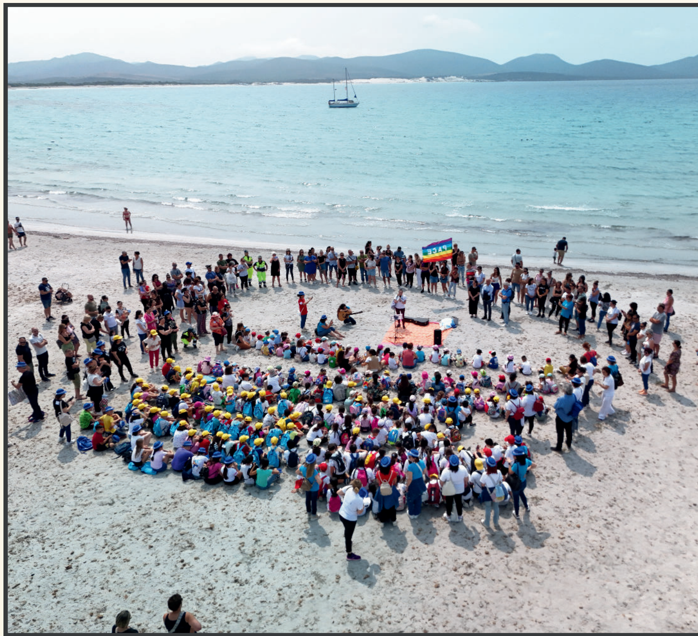
Su Filu de Paxi in Porto Pino

S'òpera, giai ammostada in Porto Pino su 5 de làmpadas passau, dd'ant fata is piciocheddus de s'Istitutu Cumprensivu Taddeo Cossu , imperendi su linu de Normandia e is arretzas de is piscadoris de Arresi e de Teulada, e dd'ant fata impari a is fedalis insoru de Tunisia, Frància e Galles cun sa punna de uniri, de manera simbòlica, is orus de mari aundi si incarant custus paisus pesendindi unu ponti de Paxi. Is rapresentantis de sa Regioni Sardigna ant acùlliu cun prexeri mannu su Filu de Paxi, faina simbòlica e cuncreta, chi in custus tempus malus chi seus bivendi fait a bessiri a craru su disìgiu de paxi chi nascit de is manus de is pipius etotu.