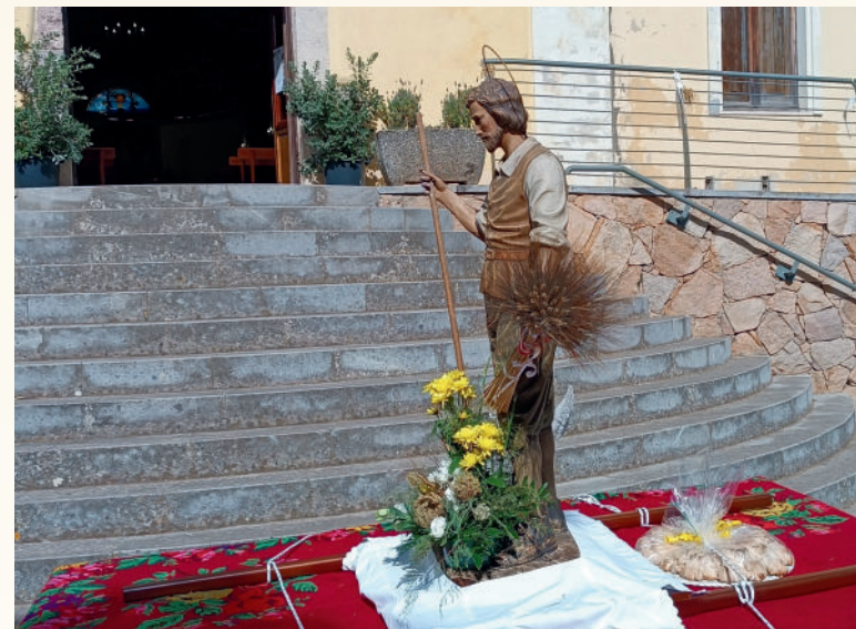
Santu Sidòriu in Santadi

...a Nostra Sennora de is Gràtzias in su medau de Sa Crèsia in Sa Baronia e su 16 in Teulada ant fatu onori a Nostra Sennora de Su Cramu cun una bella prucessioni chi at prenu is arrugas de su centru stòricu cun is coloris de sa traditzioni.