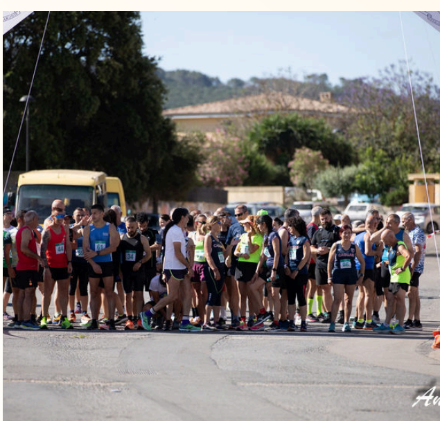
Is sportivus prontus a curri (foto de A.Cocco)

Domigu 25 de maju ant fatu sa de tres editzions de Giba di corsa . Amantiosus de s'atividadi fisica si funt atobiaus a mengianu prontus po fai una bella cursa de 10 km o, po chini non ddi praxiat a curri, una passillada de 5 km. De chi totu est acabau ant cuncordau unu pràngiu a su parcu de Is Muras. Grandu prexu e partecipazioni de sa populazioni a custu bellu event.