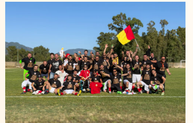
In artu su Villaperuccio 2024; in bàsciu su Sulcis Futsal

Grandu resurtau at fatu su Malasainas Calcio a 5 : s'est guadangiau sa promotzioni in C2 bincendi su girone B de sa sèrie D e pustis at bintu sa Coppa Italia regionale in Carbònia. Est pretzisu a sinnialai ca is picioas de sa Pallavolo Giba ant fatu bonu campionau in sèrie D de volley acabbendi a su de 5 postus e ca est acanta de incumentzai s'aventura de su Sulcis Futsal , una squadra, fundada ocannu, de fuba a 5 sceti de fèmminas chi tenit bidei de partecipai a unus cantu torneus de zona.