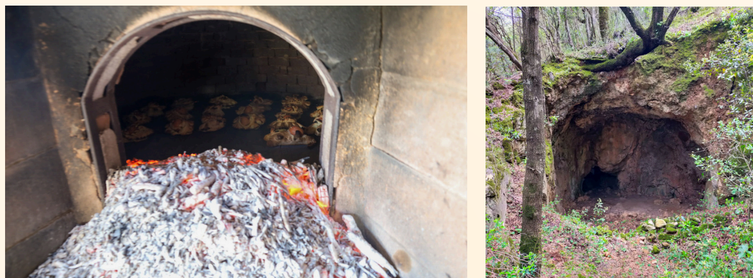
Su pani cuendi in su forru de Sa Domu Antiga e Su Tutoni de Su Tipu

Su 7 de abrili sa truma de Marevivo cun s'agiudu pretziau de su Comunu ant apariciu una giorronada in Portu Botis po arrigolli s'àliga impari a pipius e maistas de sa scola elementari S. Domenico Savio. Una bellu mengianu de soli e spàssiu utilosu po fai a cumprendi cantu siat de importu su riciclu e su respetu de sa terra aundi biveus.