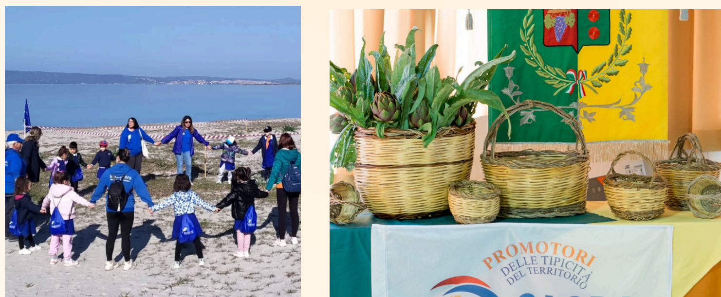
Is piciocheddus gibàius cun sa delegazione de Marevivo in Portu Botis e sa Sagra de sa Canciofa de Masainas.